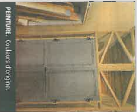
PEINTURE. Couleurs d'origine.