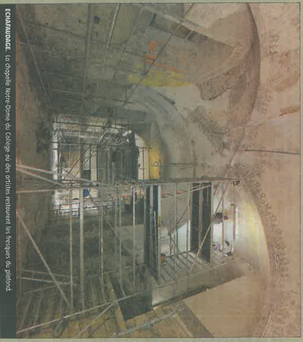
ECHAFFAUDAGE. La chapelle Notre-Dame du Collège où des artistes restaurent les fresques du plafond.