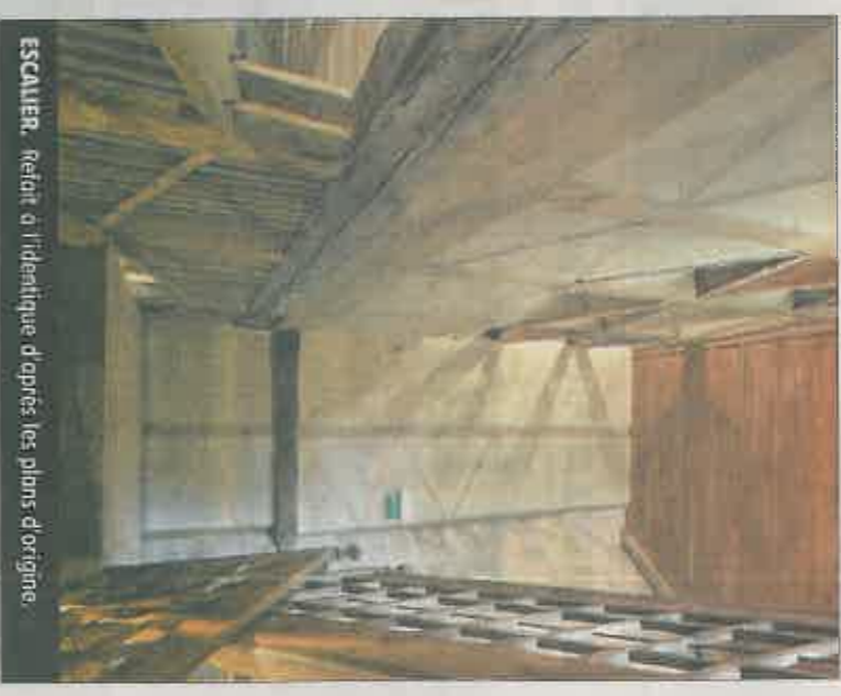
ESCALIER. Refait à l'identique d'après les plans d'origine.