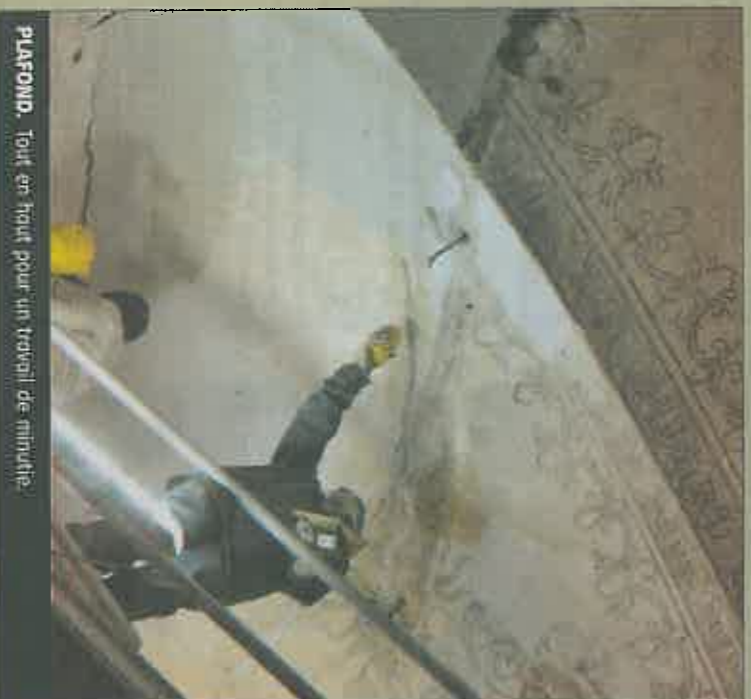
PLAFOND. Travaux en hauteur pour un travail de minutie.