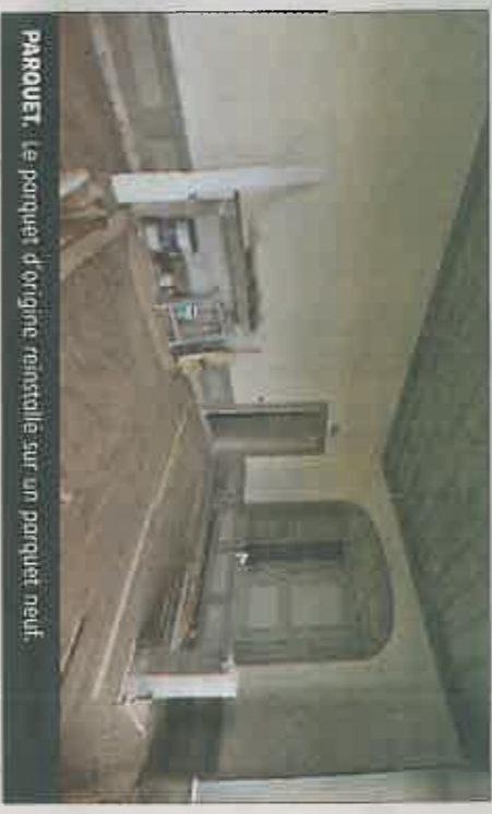
PARQUET. Le parquet d'origine réinstallé sur un parquet neuf.