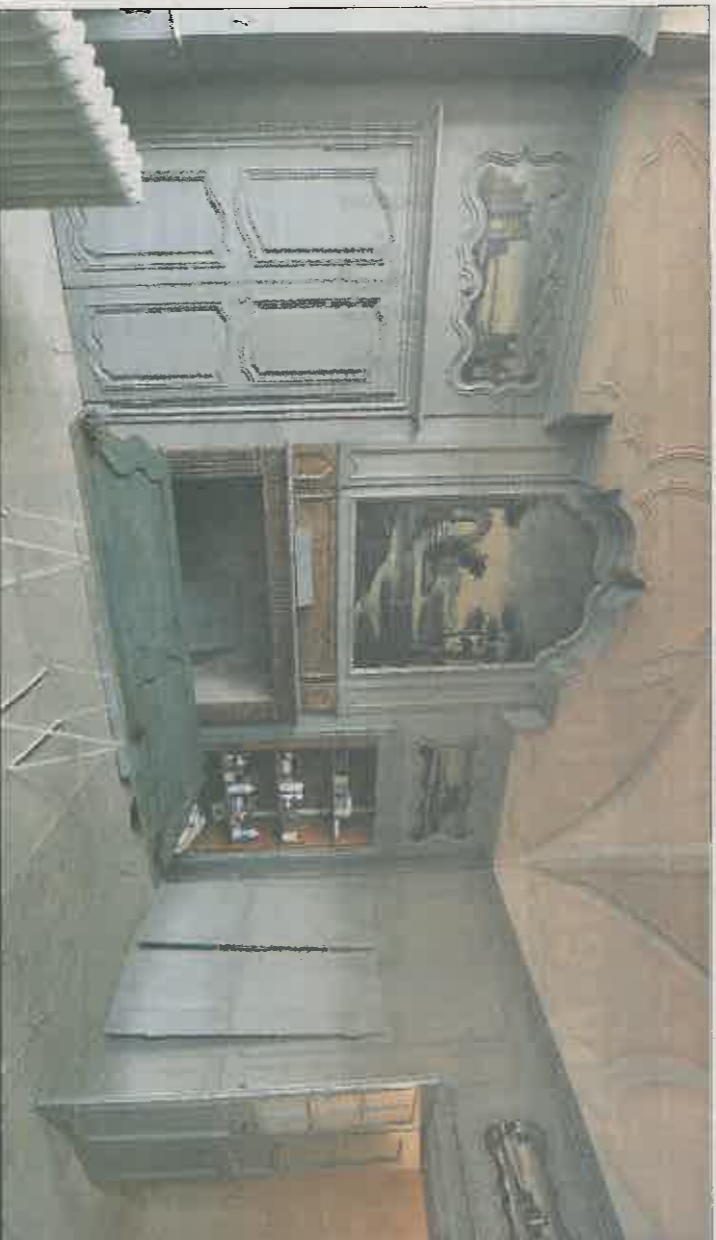
BOISERIES. L'ancienne salle des mariages de la maison Cardinal, restaurée style XVIII e .